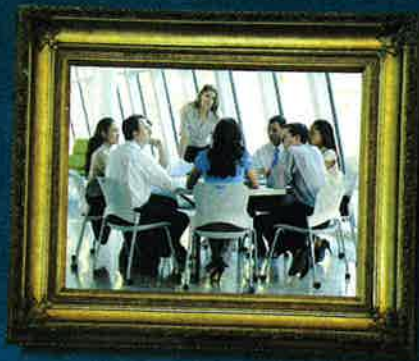
GESTIRE IL TEAM