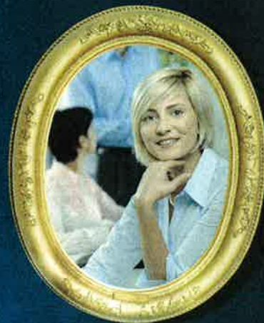
GESTIRE SE STESSI