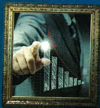
GESTIRE IL BUSINESS